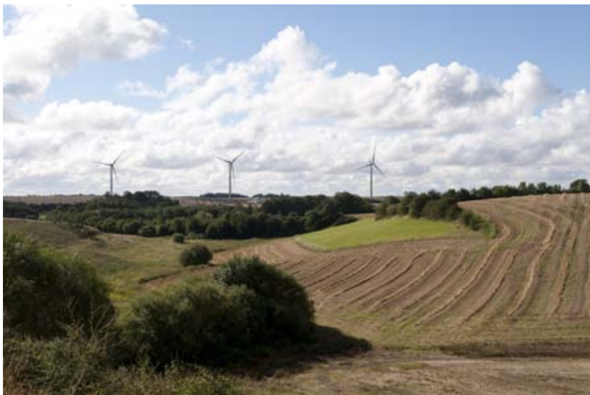
Visualisering mod syd fra motorvejen, hvor denne passerer Kåtbæk Ådal.

Jævnfør vejledningen om reglerne i Lov om landbrugsejendomme, kræves Jordbrugskommissionens tilladelse til brugs- eller lejeaftaler om opstilling af vindmøller på en landbrugsejendom, hvis vindmøllernes grundareal er på over 25 m 2 , eller aftalen gælder for et længere tidsrum end 30 år. Ophævelse af landbrugspligten ved eventuel udstykning af arealer til fundamenter, arbejdsarealer og tilkørselsveje kræver også kommissionens tilladelse.