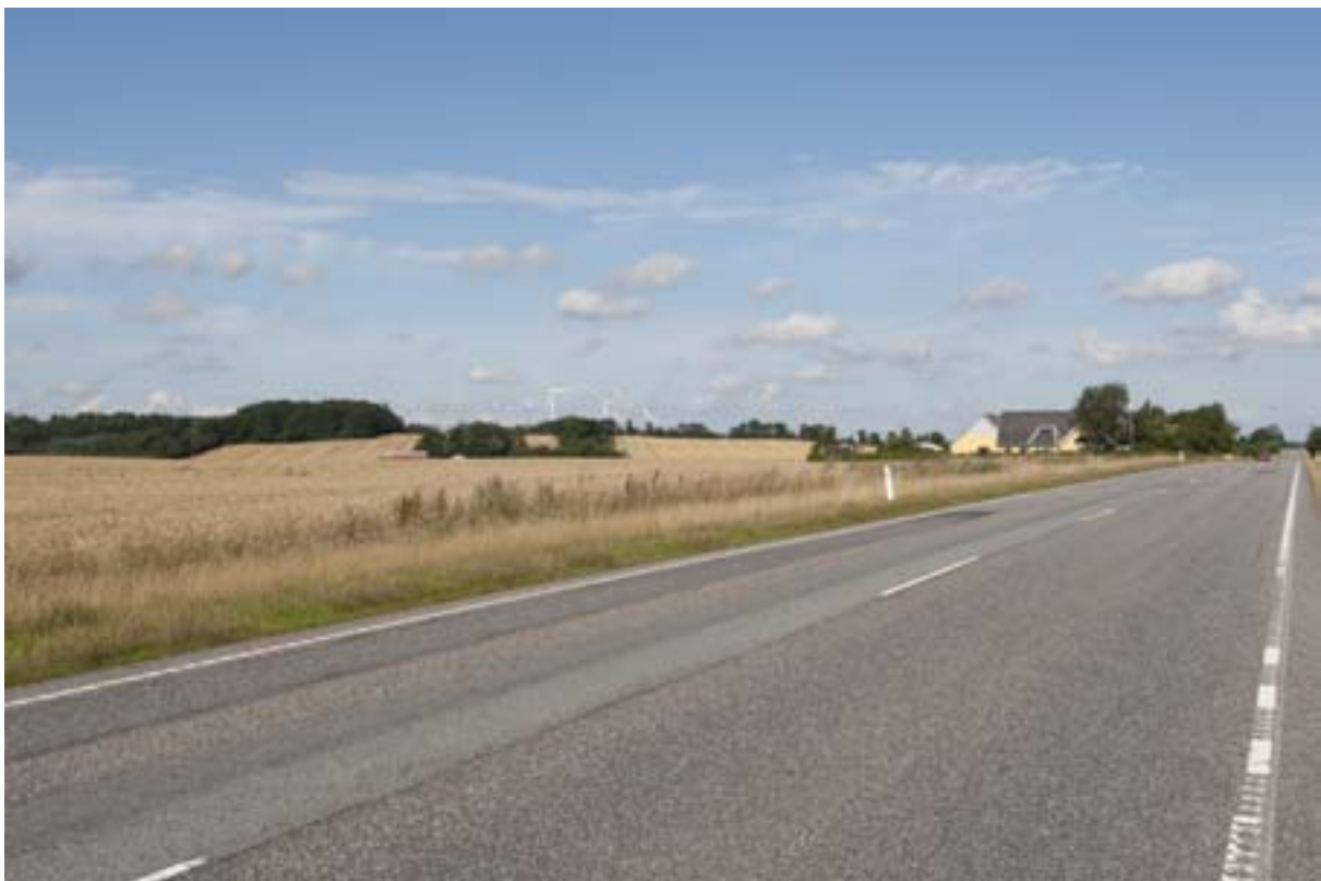
Visualisering mod nordvest fra Hovedvejen (rute 180).