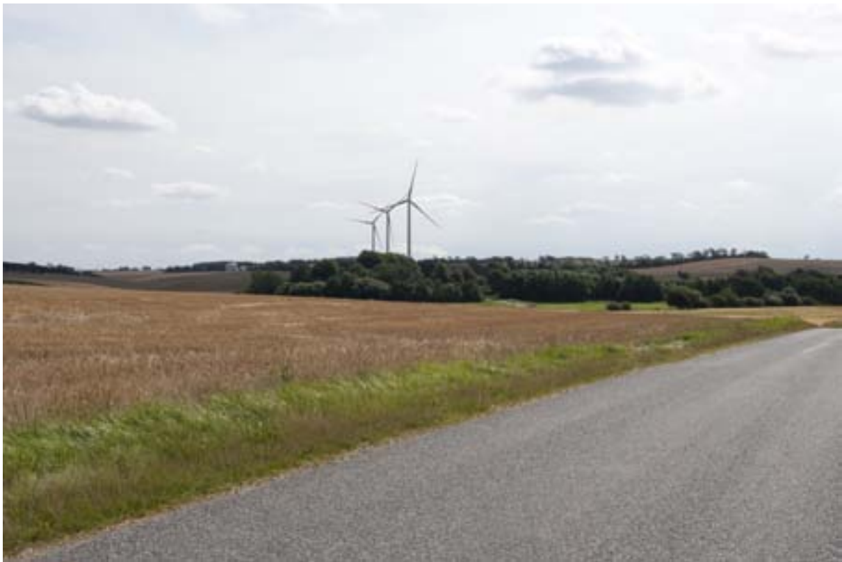
Visualisering mod sydøst fra Ørrildvej ved Fårups sydlige bygrænse.