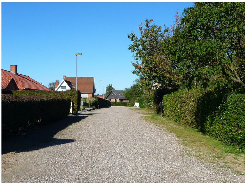
Til venstre // Grusbelagt boligvej i Vorup med et pragmatisk, næsten landligt præg, der giver kvarteret sin helt egen charme.