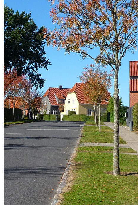
Ovenfor // Villavej i Kristrup med grønne rabatter og rumdannende vejtræer, der giver indtryk af et helstøbt og grønt boligkvarter.

En bevidst bearbejdning af udenomsarealerne, hvad enten det er private haver eller fælles friarealer, er afgørende for at skabe sammenhæng mellem bygningen og omgivelserne. I samspillet mellem bebyggelsen og friarealerne, eller huset og haven, kan der opstå værdifulde sammenhænge og god arkitektur. Også på grund af klimaforandringer med øgede regnmængder bør man overveje nøje, inden man vælger at befæste hele haven med fliser og sten, der forhindrer regnvandet i at trænge igennem.