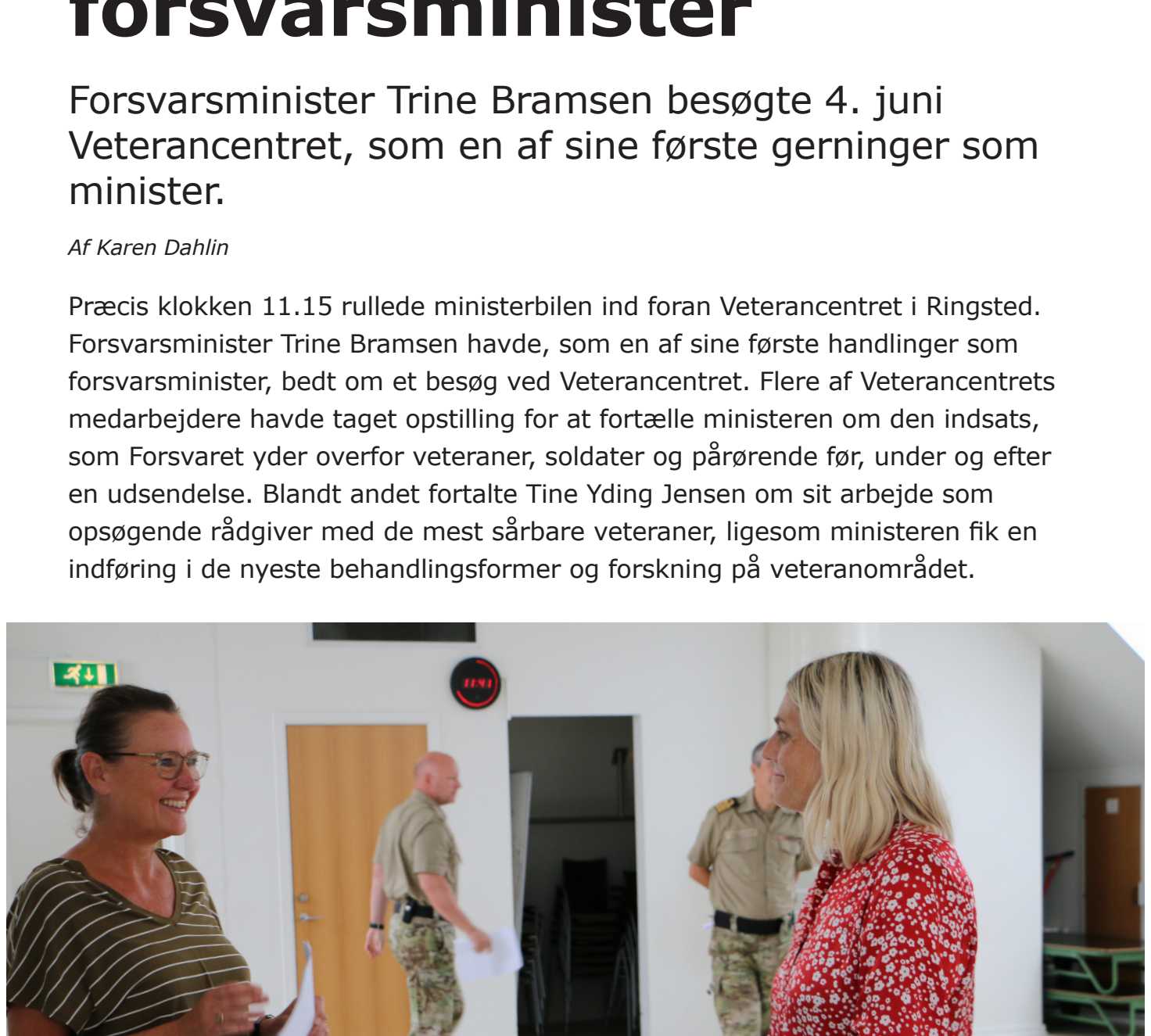
Forsvarsminister Trine Bramsen fik en grundig indføring i Veterancentrets arbejde - herunder samarbejdet med kommunerne i konceptet "Fælles om veteraner".