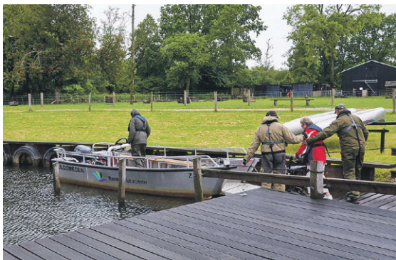
Randers Naturcenter tilbyder bådsejls på Gudenå med meget handicapvenlige både. Bådene har en nedfældelig bagklap, så kørestols- og rollatorbrugere kan rulle ubesværet ombord.