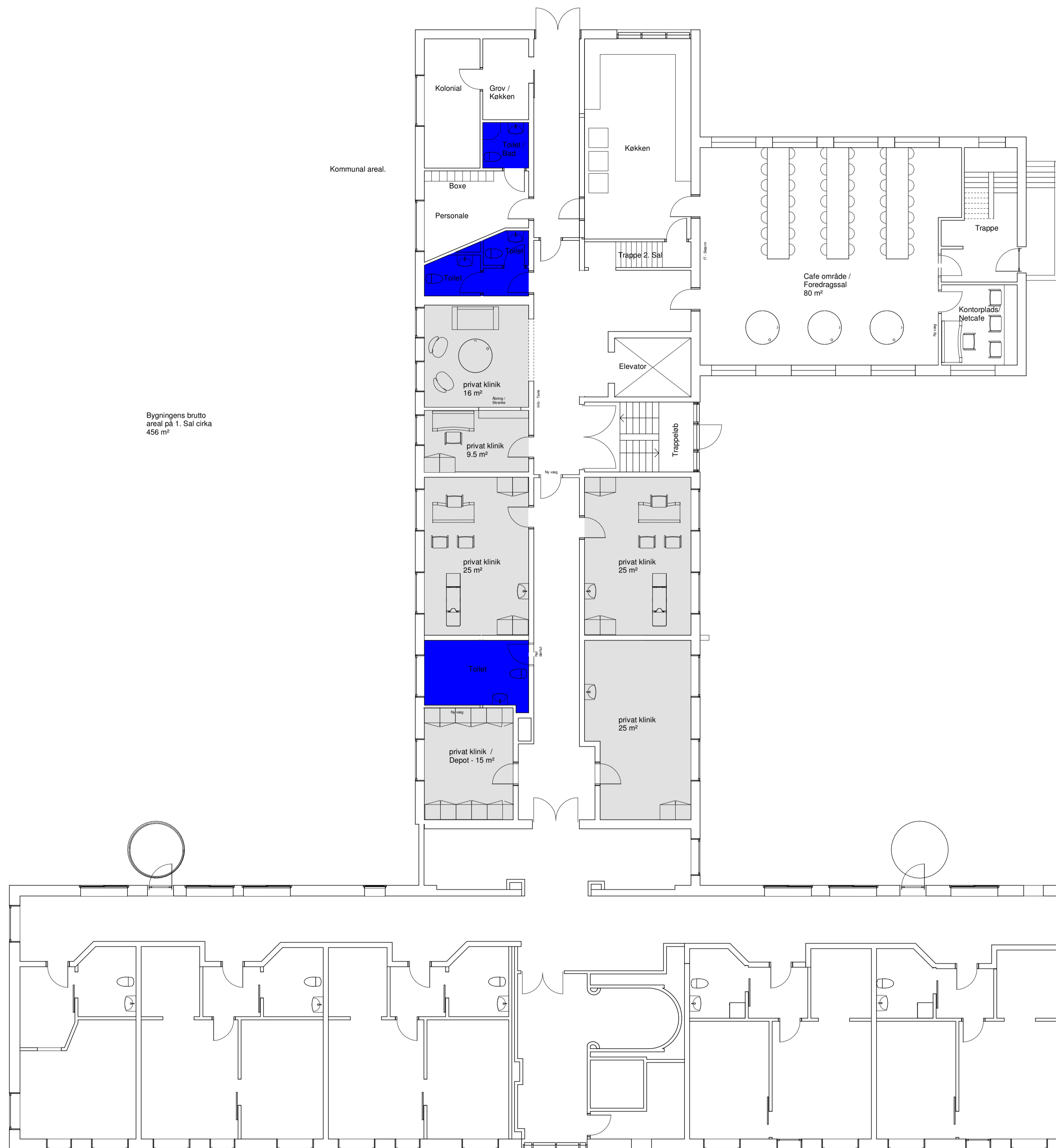
1. Sal - 1 : 100 - Oplæg til ny indretning