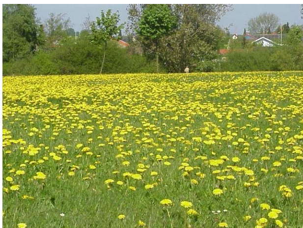
Fælledgræs på nærringsrig jord umiddelbart før klipning