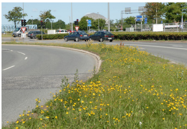
Fælledgræs på dårlig jord før klipning.

Fælledgræs er en grov græstype, som findes i større parker og naturområder, hvor der ønskes ekstensiv drift. Der er udbredt færdsel og publikumsadgang på fælled- græs, som ikke er egnet til boldspil. Langs tilstødende elementer, som stier og omkring udstyr kan græsset evt. plejes som andet græselement, f.eks. græsflade.