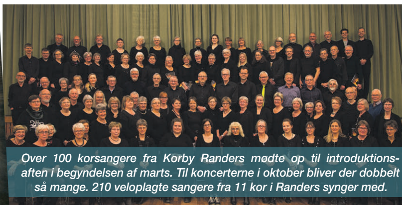
Over 100 korsangere fra Korby Randers mødte op til introduktionsaften i begyndelsen af marts. Til koncerterne i oktober bliver der dobbelt så mange. 210 veloplagte sangere fra 11 kor i Randers synger med.

Pensionister tilbydes billetter til koncerterne til en særpris på 200 kroner - eller 160 kroner hvis billetten bestilles hos "Værket" på tlf. 89 13 51 10 som "pensionistbillet". Det er en rabat på 30 kroner pr. billet.