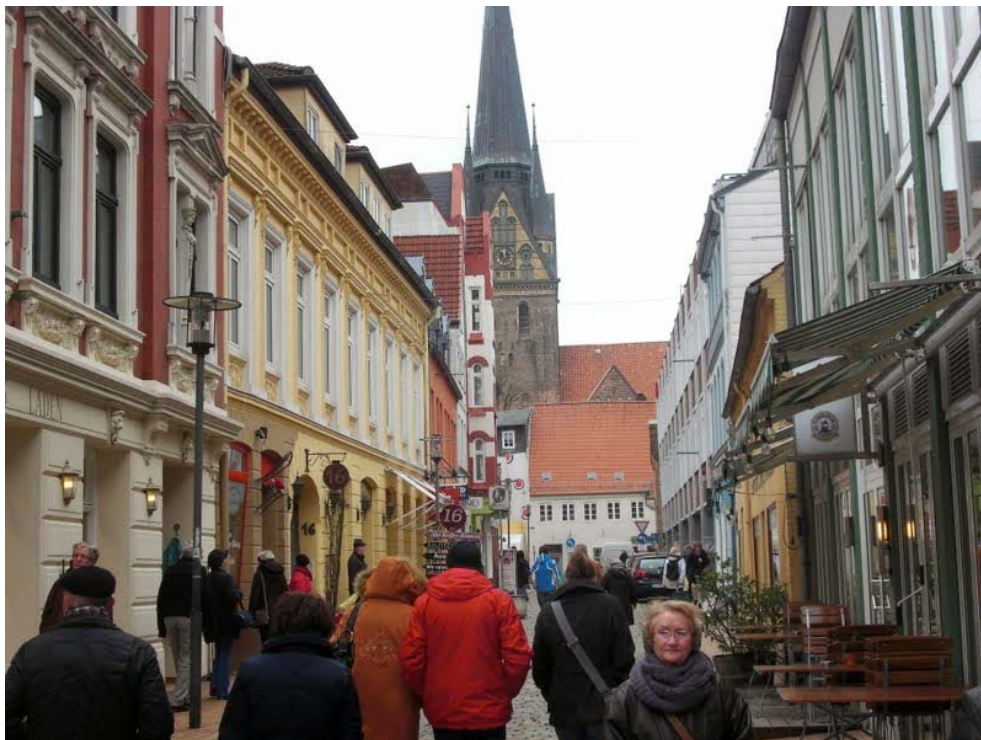
Rote Strasse, Flensburg